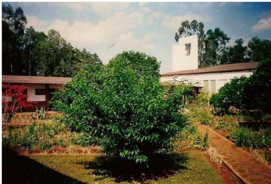
Parròquia de Nyabikere