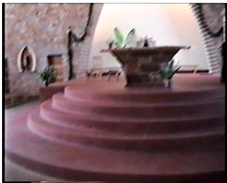
ESGLÉSIA DE RABIÓ