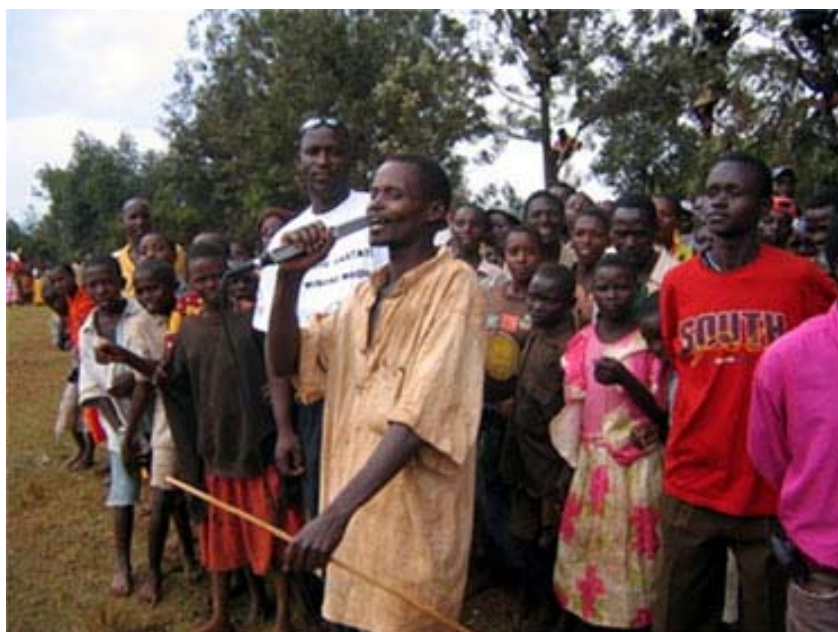
“Meeting” a GITEGA

Aquesta dotzena de Documents que he pujat a n’aquesta pàgina ho demostren.