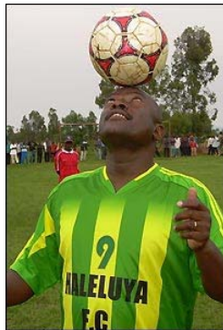
P. NKURUNZIZA President Burundi