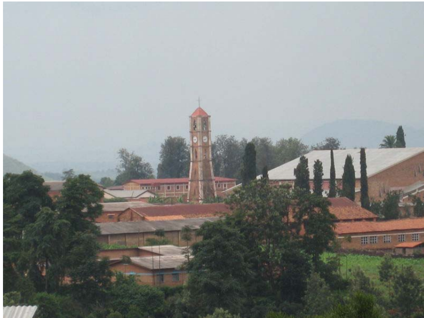
Catedral de GITEGA

A mi no m'hi ha caigut mai enfora, des de que el vaig conèixer. Sempre vaig pensar que possiblement hi tornaria quan les obligacions “familiars” ho permetessin, com així ho vaig fer al 1997. Ma mare havia mort l'any 1996.