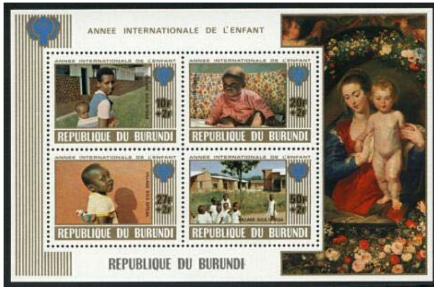
Segells de Burundi