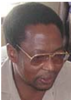
L. NYANGOMA Fundador CNDD