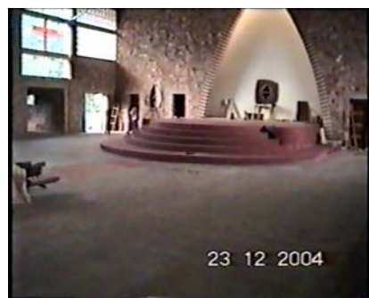
ESGLÉSIA DE RABIRO