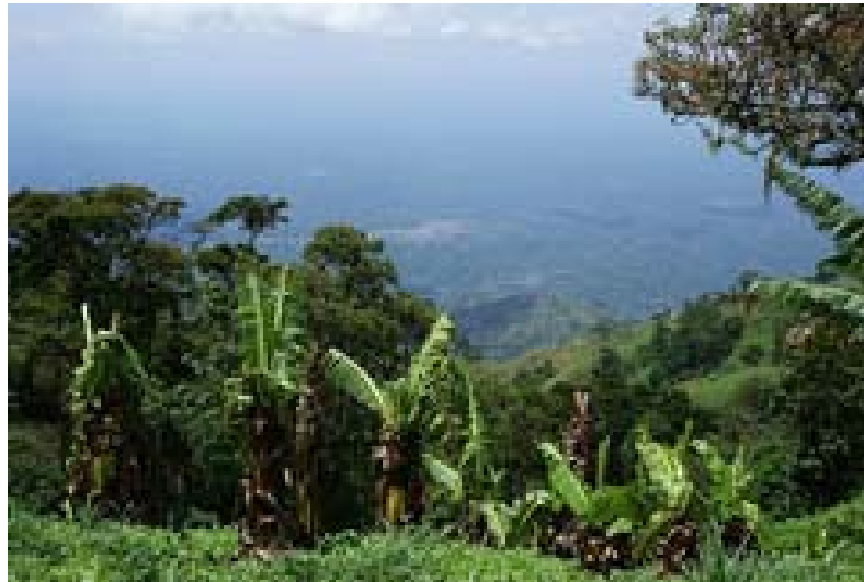
Panoràmica del paisatge burundès

Potser NKURUNZIZA i els seus facin el Burundi que Rwagasore, umuganwa, i els seus companys hutu esperaven fer.