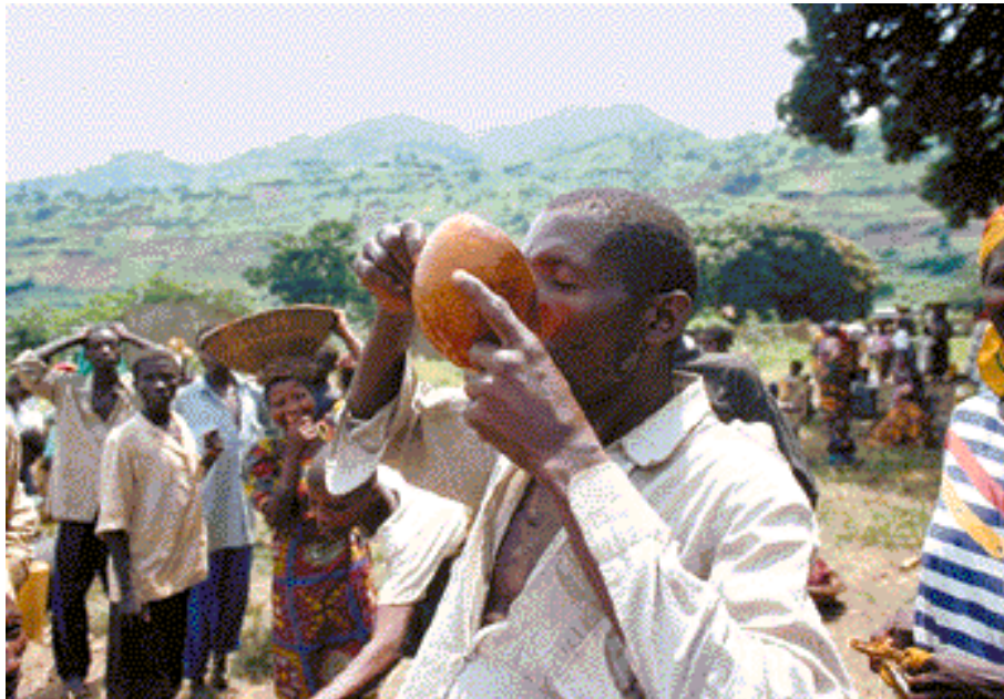
Cervesa al 2004